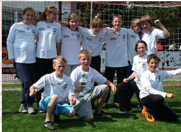
"Op Dreef 6" winnaars 2011